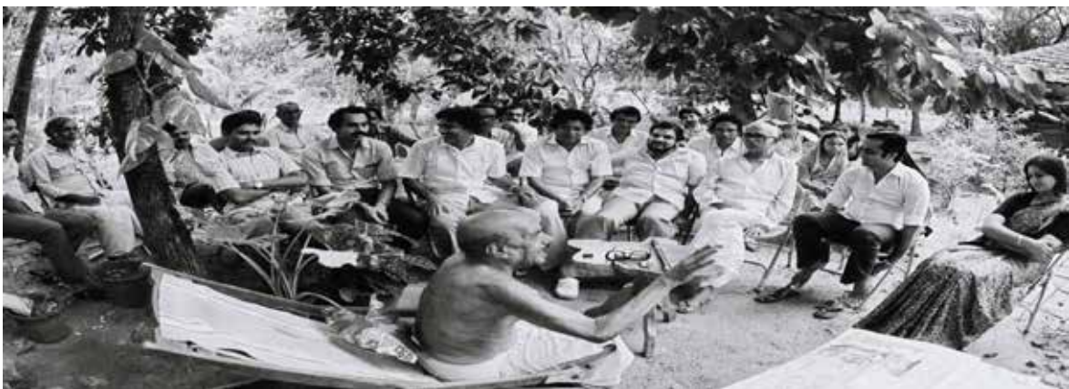
വൈക്കം മുഹമ്മദ് ബഷീർ- മാക്കോസ്സിൻ മരച്ചുവട്ടിലിരുന്ന് മലയാള ഭാഷാ വ്യാകരണത്തെ 'പളുക്കുസാക്കിയ വിശ്വസാഹിത്യകാരൻ