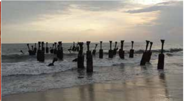
1572-ൽ കോഴിക്കോട് തുറമുഖം